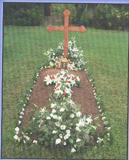
Τό ἀπέριττον μνήμα του.